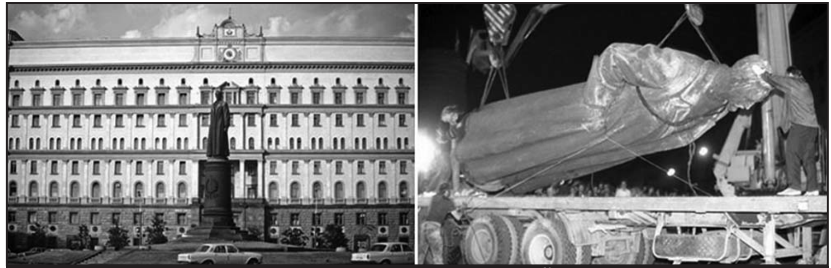
НЕКОТОРЫЕ ХИТРОМУДРЫЕ ПУГАЮТ НАС МАЙДАНом В РОССИИ. А Я ГОВОРЮ ВАМ: МОСКОВСКИЙ МАЙДАН СОСТОЯЛСЯ 22 АВГУСТА 1991 ГОДА!

Стоит нам отказаться от остатков отечественной промышленности по примеру Назарбаева, завтра же станем рабами. Не пора ли вспомнить лозунг: «Мы не рабы, рабы — не мы»? Доселе никогда угроза стать рабами не была столь реальной. Даже во времена ига Золотой Орды рабство нам так не угрожало! Стремление «реформаторов» загнать русских в кабалу понятно, но вызывает такое отторжение, что им пора бежать из России. Благо, посадочные площадки у всех подготовлены.